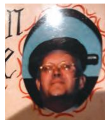
40-jarig Huwelijk "Levend Schilderij", kort toneelstuk t.g.v. jubileum van de kerk