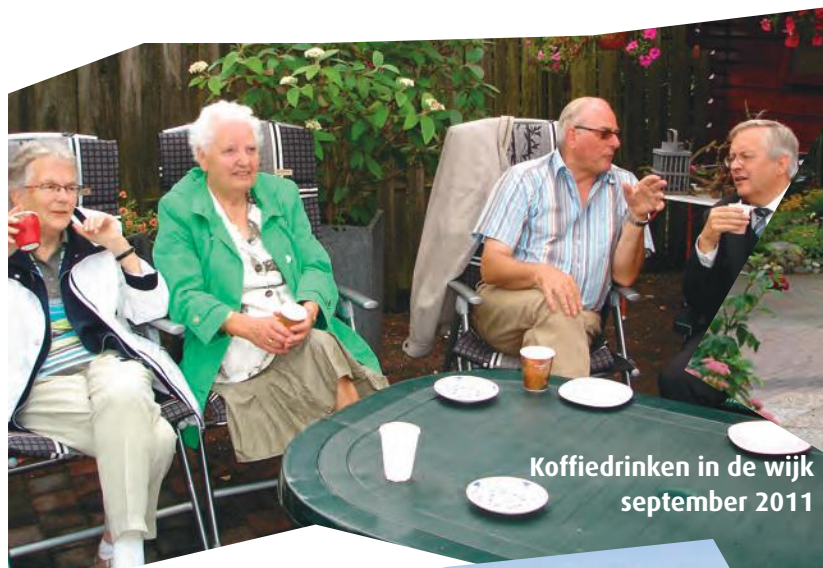
Koffiedrinken in de wijk september 2011