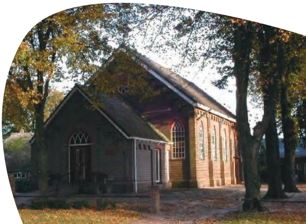
Gereformeerde kerk PKN Gees

Op een dag kwam ds. Boukes bij ons en vertelde dat hij die nacht heel slecht had geslapen. Hij had namelijk heel veel bezoek gehad en of Henk wel even mee wilde om te kijken. Henk ging dan ook mee. Groot was de verbazing toen