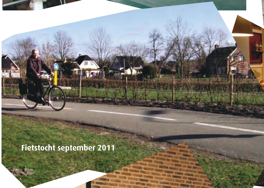
Fietstocht september 2011