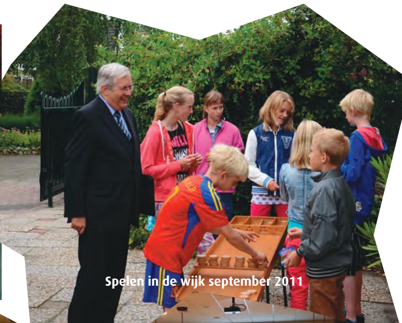
Spelen in de wijk september 2011