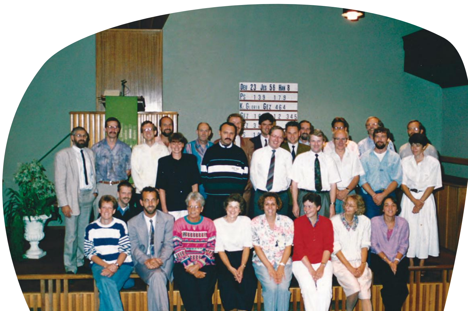
Voltallige kerkenraad met dominee

Kortom: de dominee heeft een onuitwisbare indruk achtergelaten in Hardinxveld. Veel gemeenteleden kijken met een positief gevoel terug op die tijd. Nu nog steeds, als de dominee hier komt preken, stroomt de kerk weer vol. Hopelijk laat hij in Damwoude net zo’n indruk achter, als hier.