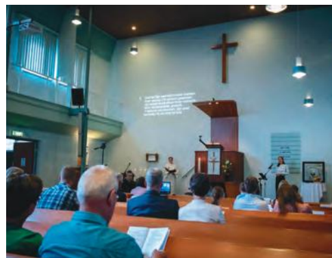
Zondagse Samenkomst nu