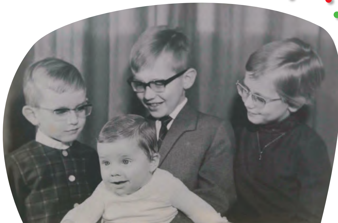
Het gezin in 1964

Hij hield enorm van lezen, en zat het liefst in een hoekje met een boek