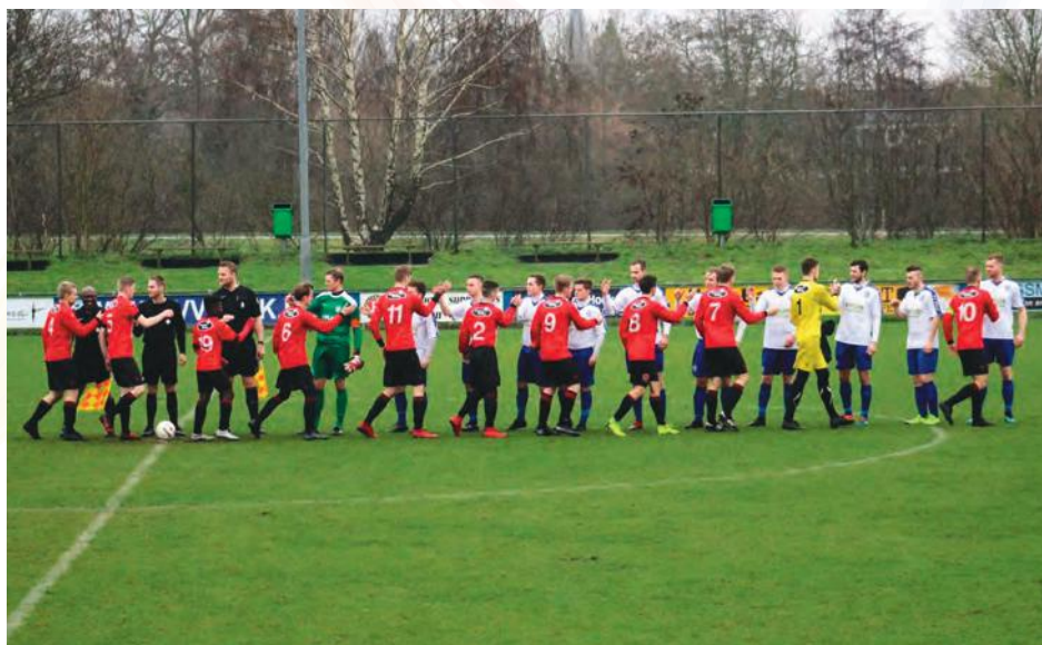
Broekster Boys 1- Balk 1 08-02-2020