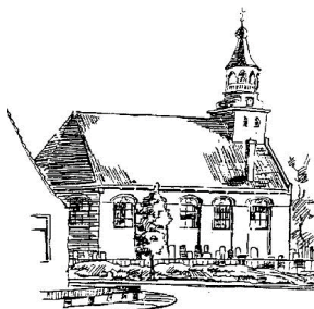
De Ikker - Hearewei 1