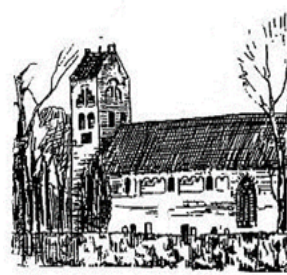
Bonifatiuskerk - Foarwei 2

IKKERWÂLD, MOARMWÂLD, BROEKSTERWÂLD & DE FALOM